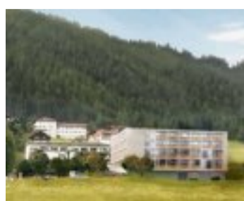
Im Vordergrund: Das neue Gebäude zum bestehenden Alterszentrum Bergsonne.