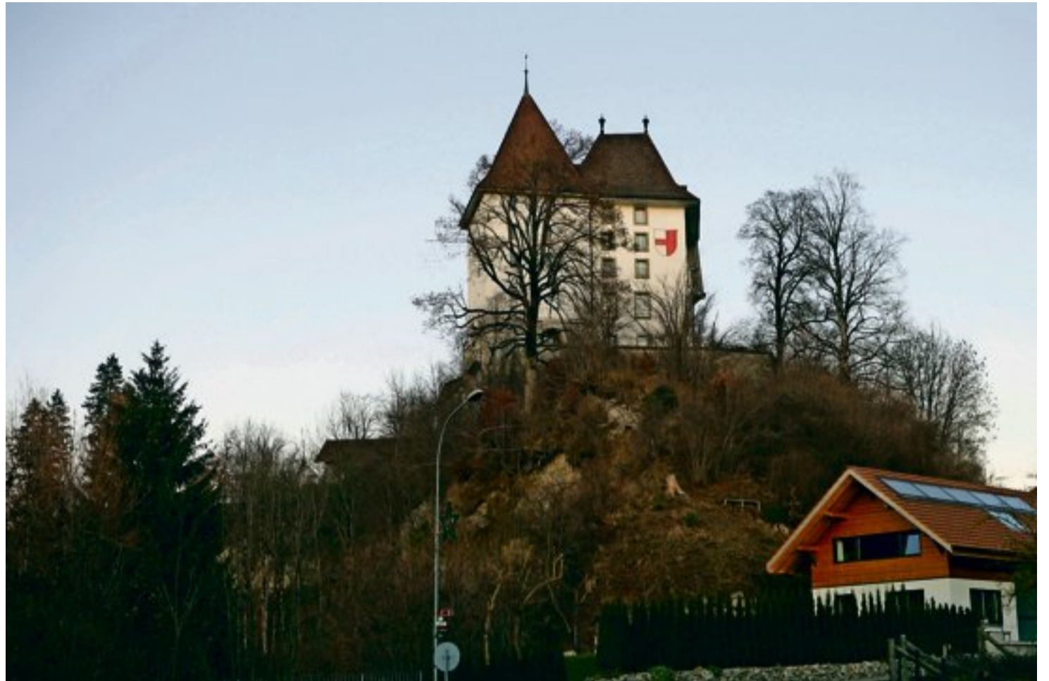
Hohe Kosten: Die Miete für das Schloss beträgt 80 000 Franken pro Jahr, dazu kommen noch Heiz- und Nebenkosten.

Seit rund zwei Wochen sucht Sumiswald einen neuen Schlossherren. Und es zeigt sich, dass die